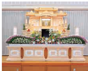
※オリジナルセットにおける祭壇の一例です