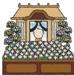
協力企業 ベルモニー葬祭

家族葬と一口に言っても喪家によって形は様々です。ベルモニーが提唱する「選べる家族葬」では「家族葬の規模」や「式場」「案内方法」「葬儀品」について、お客様の想いに応じて提案し、お選び頂けます。今回はその「選べる家族葬」について終活カウンセラーの有資格者であるスタッフが詳しくお話しいたします。