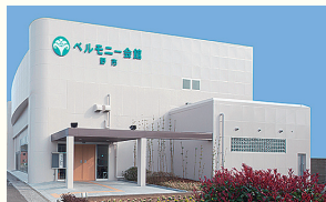
ベルモニー会館 野市 香南市野市町東野1432-1