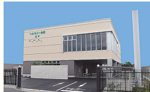
ベルモニー会館 瀬戸 高知市瀬戸南町2丁目13-11