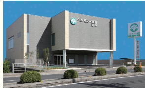
ベルモニー会館 高須 高知市高須1丁目12-20