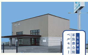
完全貸切家族葬会館 ベルモニー結 大津 高知市大津乙1054-3