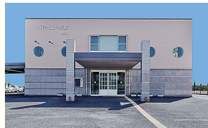
ベルモニー会館 具同 四万十市具同5353-1