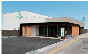
ベルモニー会館 古津賀 四万十市古津賀2198-1