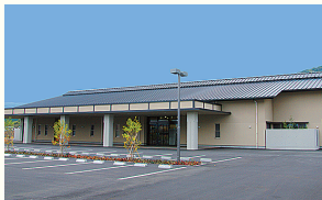
ベルモニー会館 宿毛 宿毛市駅前町1丁目1103