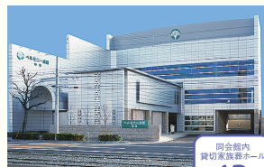
ベルモニー会館 愛宕山 高知市愛宕山66-1