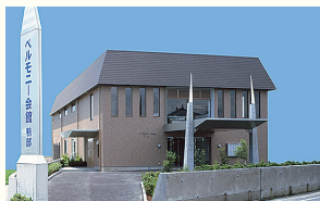
ベルモニー会館 鴨部 高知市鴨部3丁目21-3