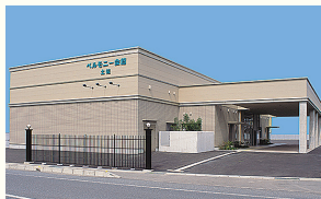
ベルモニー会館 土佐 土佐市蓮池1043-1