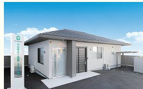
ベルモニー会館 土佐清水 別館 土佐清水市旭町4-18