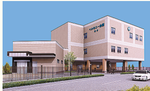
ベルモニー会館 福井 高知市福井町1251