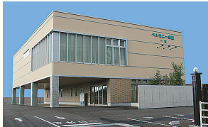
ベルモニー会館 一宮 高知市一宮東町1丁目4-14