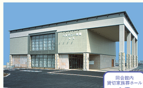
ベルモニー会館 南国 南国市篠原100