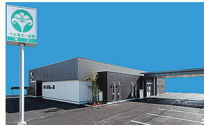
ベルモニー会館 潮江 高知市仲田町8-5