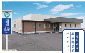
完全貸切家族葬会館 ベルモニー結 須崎東 須崎市妙見町1-8