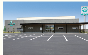
ベルモニー会館 須崎西 須崎市西町2-8-17