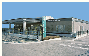
ベルモニー会館 朝倉 高知市朝倉丙486-1