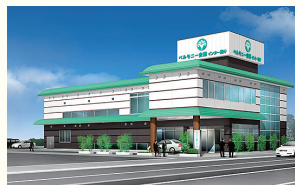
ベルモニー会館 インター通り 高知市杉井流21-17