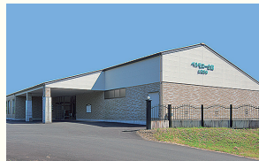
ベルモニー会館 土佐清水 土佐清水市浦尻6-1