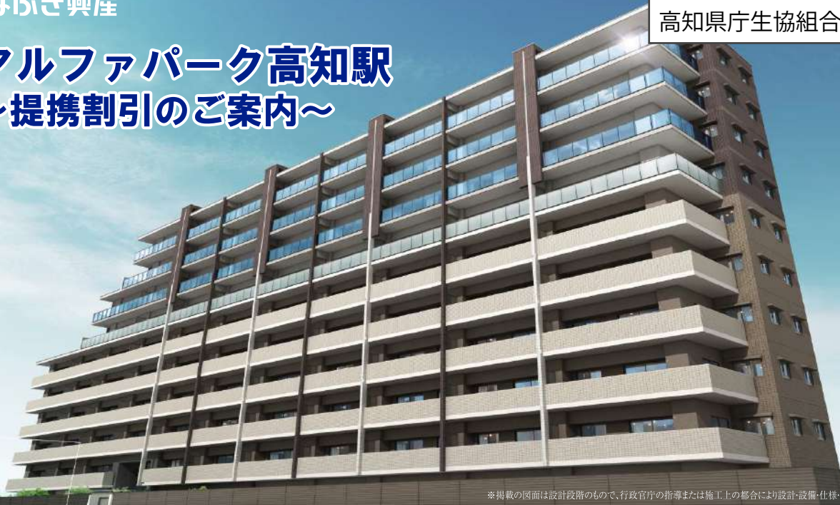
※掲載の図面は設計段階のもので、行政官庁の指導または施工上の都合により設計・設備・仕様・色調等の変更がある場合がございます。

【販売価格】 2LDK 2,980万円(税込)～／3LDK 3,280万円(税込)～