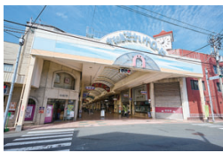
宇和島さきやロード(徒歩2分/約100m)