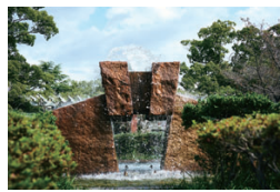
和雲公園(徒歩7分/約540m)