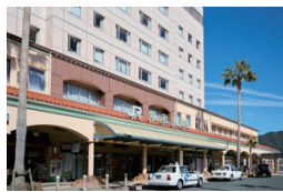
宇和島駅(徒歩5分/約380m)

中心市街地だから叶う、格別のライフスタイル。街と暮らしを愉しみ尽くす拠点として。