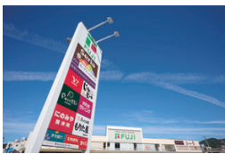
FUJII宇和島店(徒歩5分/約390m)