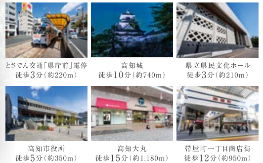
とさでん交通「県庁前」電停 徒歩3分(約220m)