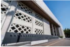
県立県民文化ホール 徒歩3分(約210m)