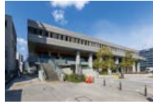
高知市役所 徒歩5分(約350m)