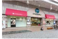
高知大丸 徒歩15分(約1,180m)