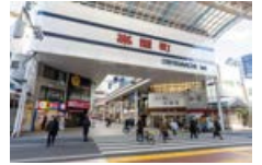
帯屋町一丁目商店街 徒歩12分(約950m)