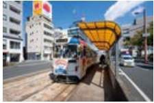
とさでん交通「県庁前」電停 徒歩3分(約220m)