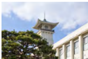
高知追手前高等学校

高知城へと続く緑が美しい並木道。そんな高知都心の追手筋は、情報が集積する図書館「オーテピア」、創立百年を越える「高知追手前高等学校」、「土佐女子中学高等学校」などが揃い、文教の豊かさが薫ります。その近隣に誕生する「ロイヤルガーデン追手筋」。この暮らしには、未来育む安らぎが広がっています。