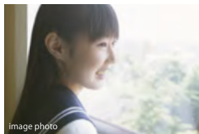
土佐女子中学高等学校

TOSA JOSHI JUNIOR AND SENIOR HIGH SCHOOL